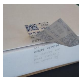
封緘シール 剥いた痕が残リ、再貼付不可