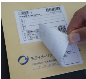
配送伝票ラベル 被着体の意匠・文字読み取り可 擬似接着層への印刷も可能