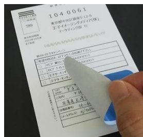
個人情報保護シール 一度剥がすと再貼付不可